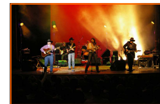
Texas Sidestep (FR)