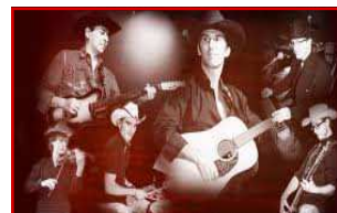
Eldorado Country Band (FR)